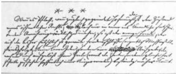
Schriftzüge von Immanuel Kant. — Ein Auszug aus dem Manuskript zu der Schrift „ Vom ewigen Frieden “.

Ein breiter Lichtstreif fiel durch das schadhafte Dach des Tempelhauses in den von der Wächterreihe der Säulen geschützten Innenraum. Er warf ein letztes Licht auf den Namen und den dunklen Marmorsarkophag.