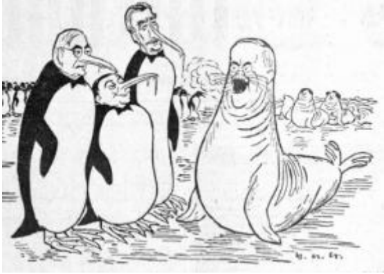
Kalte Konferenz Die Weltwoche, Zürich